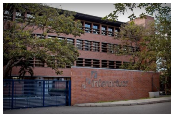
Ilustración 1: Interactuar, Sede Principal. Bello, Antioquia

Gracias a su experiencia de más de 38 años prestando servicios financieros con acompañamiento de valor para la población más vulnerable que optan por el emprendimiento, Interactuar ha identificado que un factor clave para el éxito empresarial de las unidades productivas de las zonas urbanas y rurales es la mentalidad empresarial , entendiéndose esta como la capacidad que tiene el empresario para gestionar su modelo de negocio frente a acciones de corto, mediano y largo plazo, nivel de riesgo, visión, toma de decisiones, lectura del entorno, liderazgo, iniciativa, pensamiento estratégico, entre otros, para dirigir y gestionar su empresa.