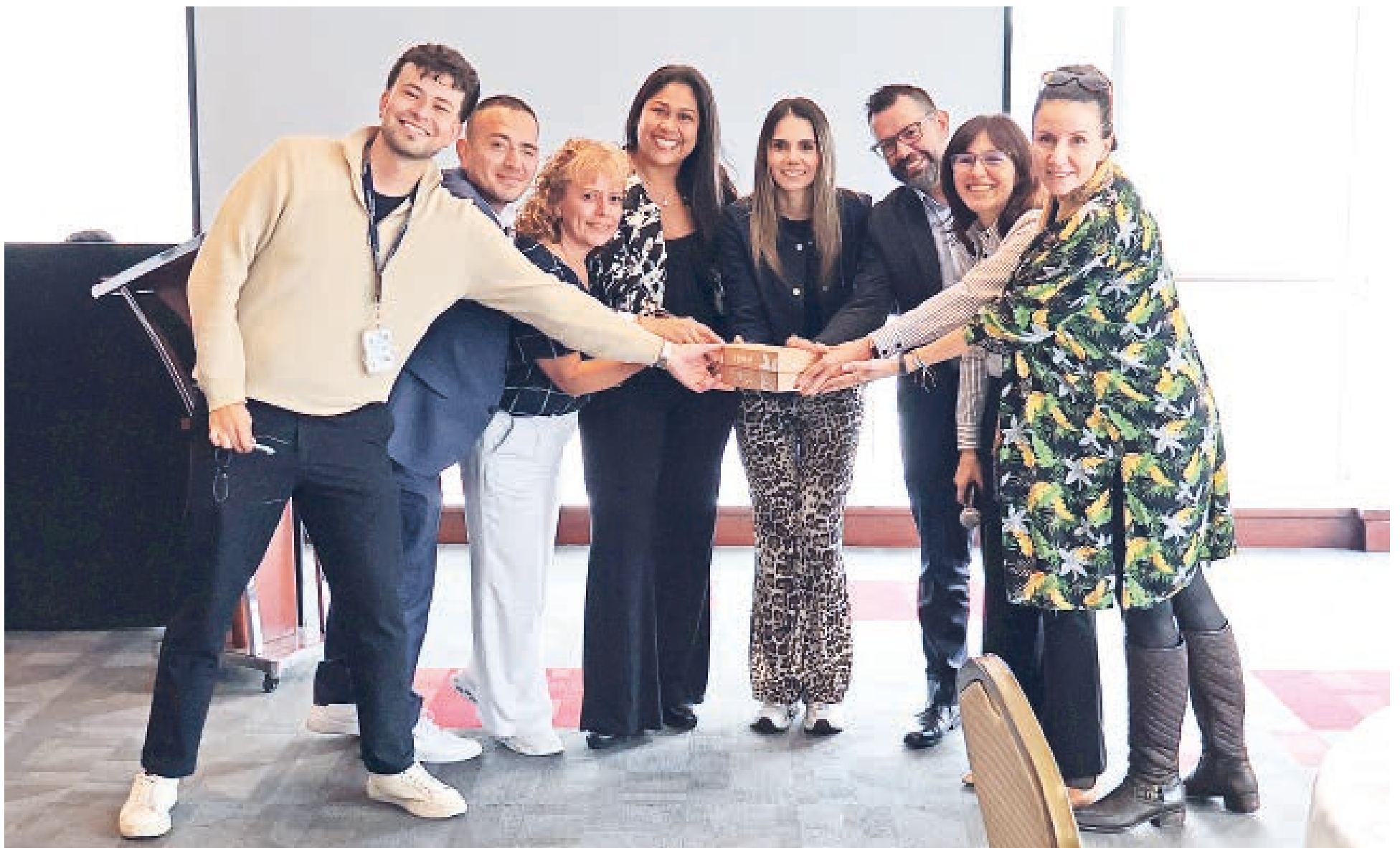
Las formaciones han establecido alianzas clave con el BID y con la ESAP.

El diplomado se diseñó como un espacio de aprendizaje activo con análisis de casos, dinámicas participativas y herramientas prácticas para la gestión de