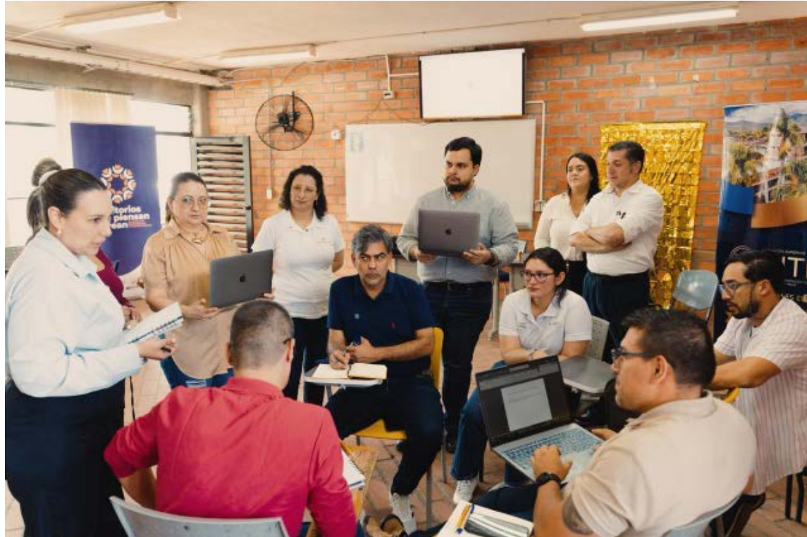
Entre los participantes hay funcionarios, líderes sociales y firmantes de paz, entre otros.

En su caso, ese aprendizaje tiene una aplicación directa. “Desde la dinámica que yo llevo como repre-