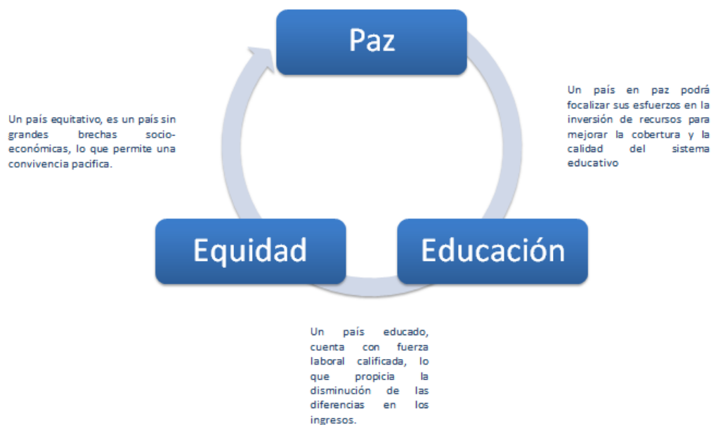
Gráfica N° 1 Pilares fundamentales Plan Nacional de Desarrollo 2014 – 2018 “Todos por un Nuevo País”

Adicionalmente, el Plan Nacional de Desarrollo “2014 – 2018 “Todos por un Nuevo País”, establece las siguientes estrategias transversales que permitirán a este Gobierno avanzar en la construcción de un país en paz, equitativo y educado: