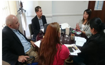
Bogotá, Noviembre 2015

Si bien los países acordaron dar por cancelado este proyecto, vale la pena destacar la misión realizada en Colombia en donde el INDI de Paraguay conoció la experiencia de Colombia sobre consulta previa para poblaciones indígenas con el Ministerio del Interior de Colombia. Se realizó también visita técnica al INCODER para obtener información y detalle técnico de sobre constitución, ampliación, reestructuración y saneamiento de resguardos indígenas.